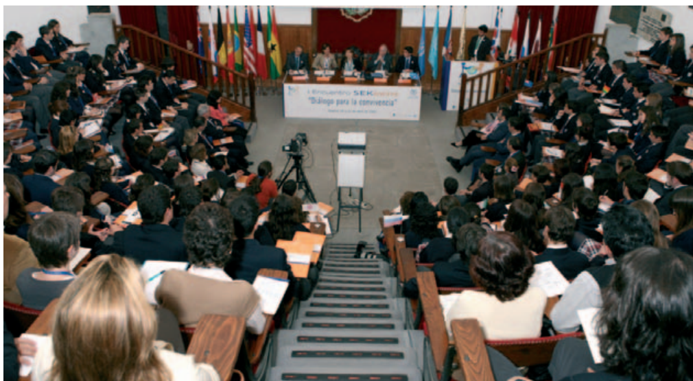
I Encuentro SEKMUN. Sesión inaugural.

La primera experiencia en la implantación del modelo Naciones Unidas fue en 1940, con la Sociedad de Naciones, entidad precursora de Naciones Unidas, en la Facultad de Ciencias